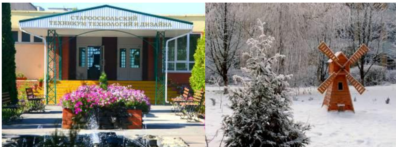
Территория учебного заведения