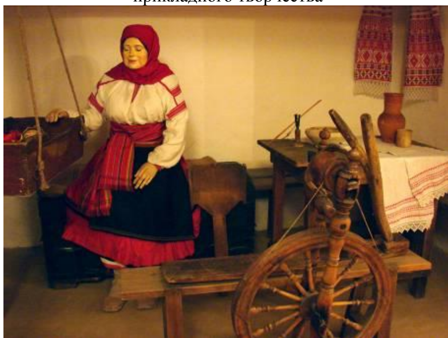
Экспонаты городского краеведческого музея, послужившие основой для исследования форм и конструкции костюма Староосколья, быта нашего края