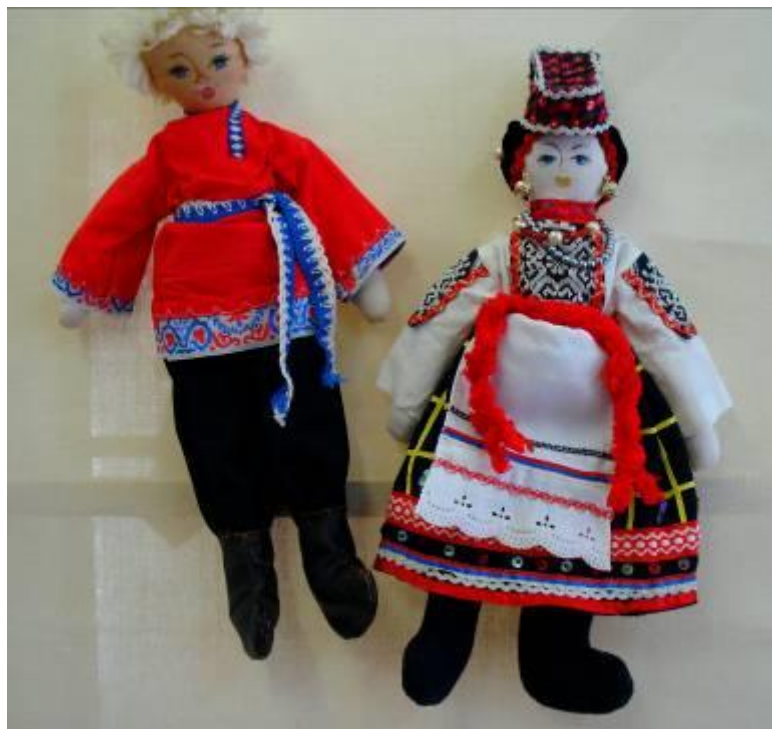
Экспонаты тряпичных кукол, изученные при посещении выставки декоративно-прикладного творчества городского Центра декоративно-прикладного творчества