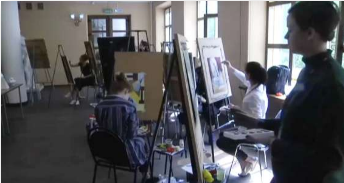
День 3. Работа над творческим заданием в цвете