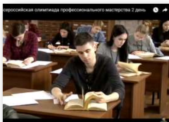
2 день. Перевод текста и выполнение рисунка