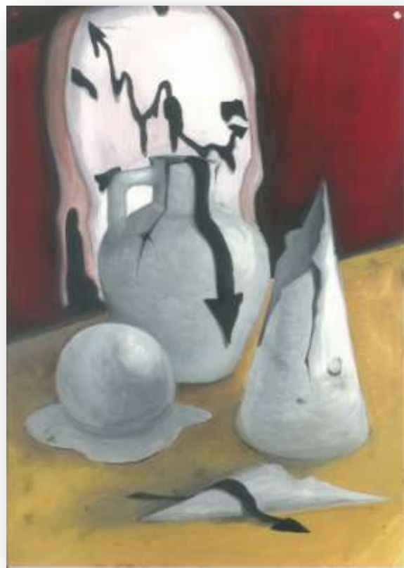
Конкурсные работы Щедриной Алёны (время выполнения: 3 часа, формат А3)